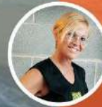
SU DURÀ Badalona