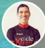
XAVI NAVEIRA Barcelona