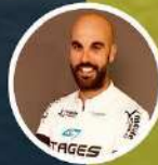
XAVI MORENO Barcelona